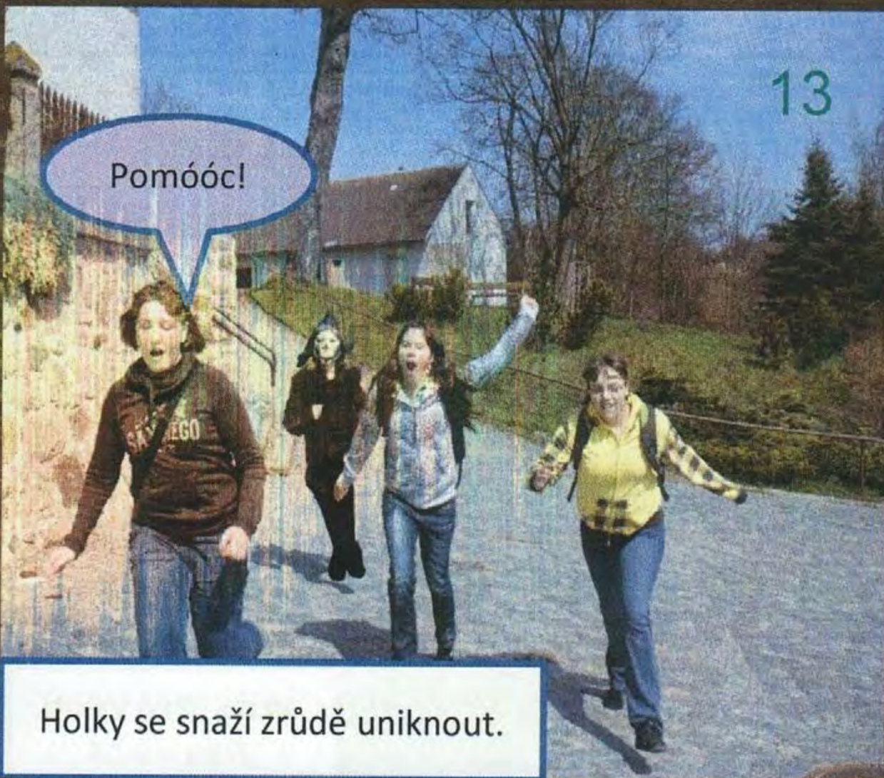
Holky se snaží zrudě uniknout.