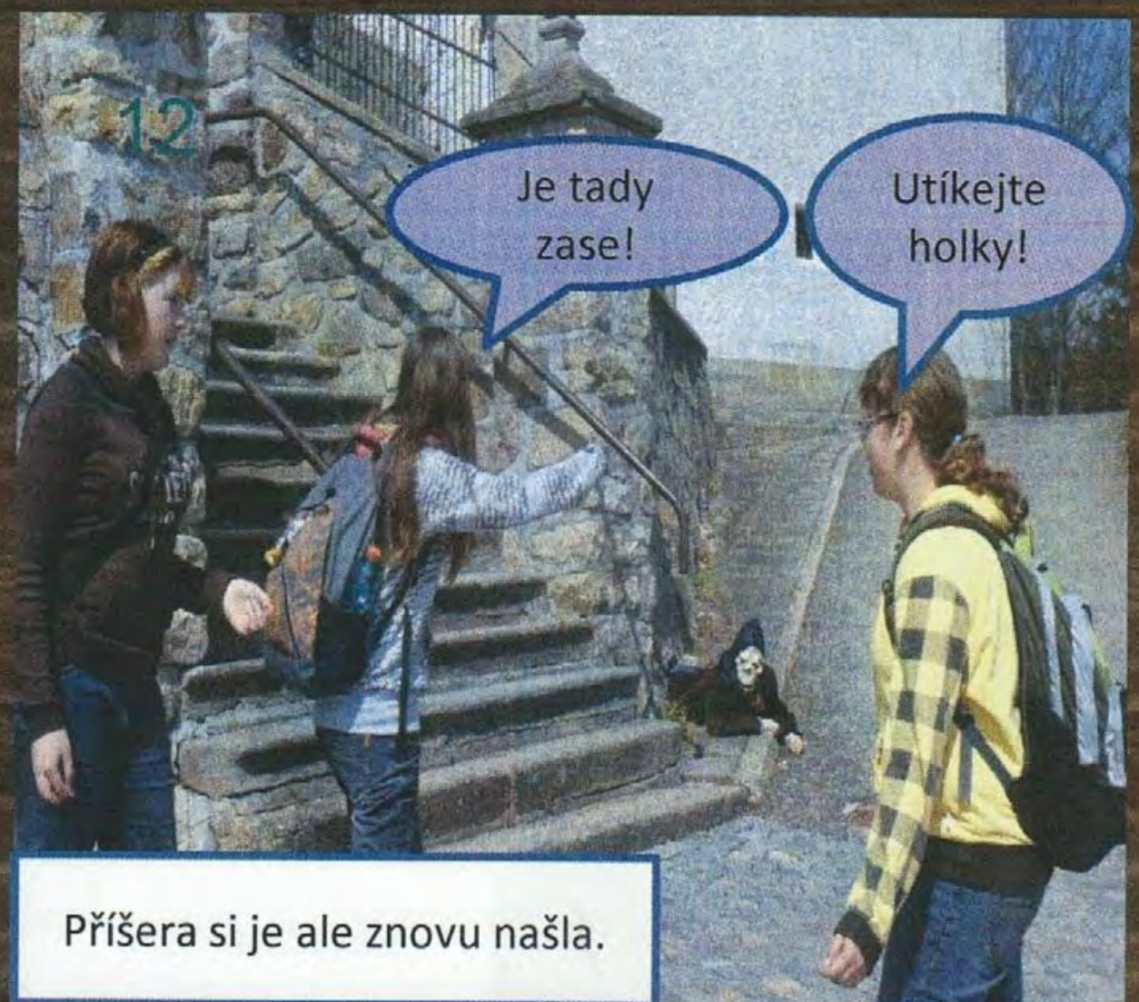
Příšera si je ale znovu našla.