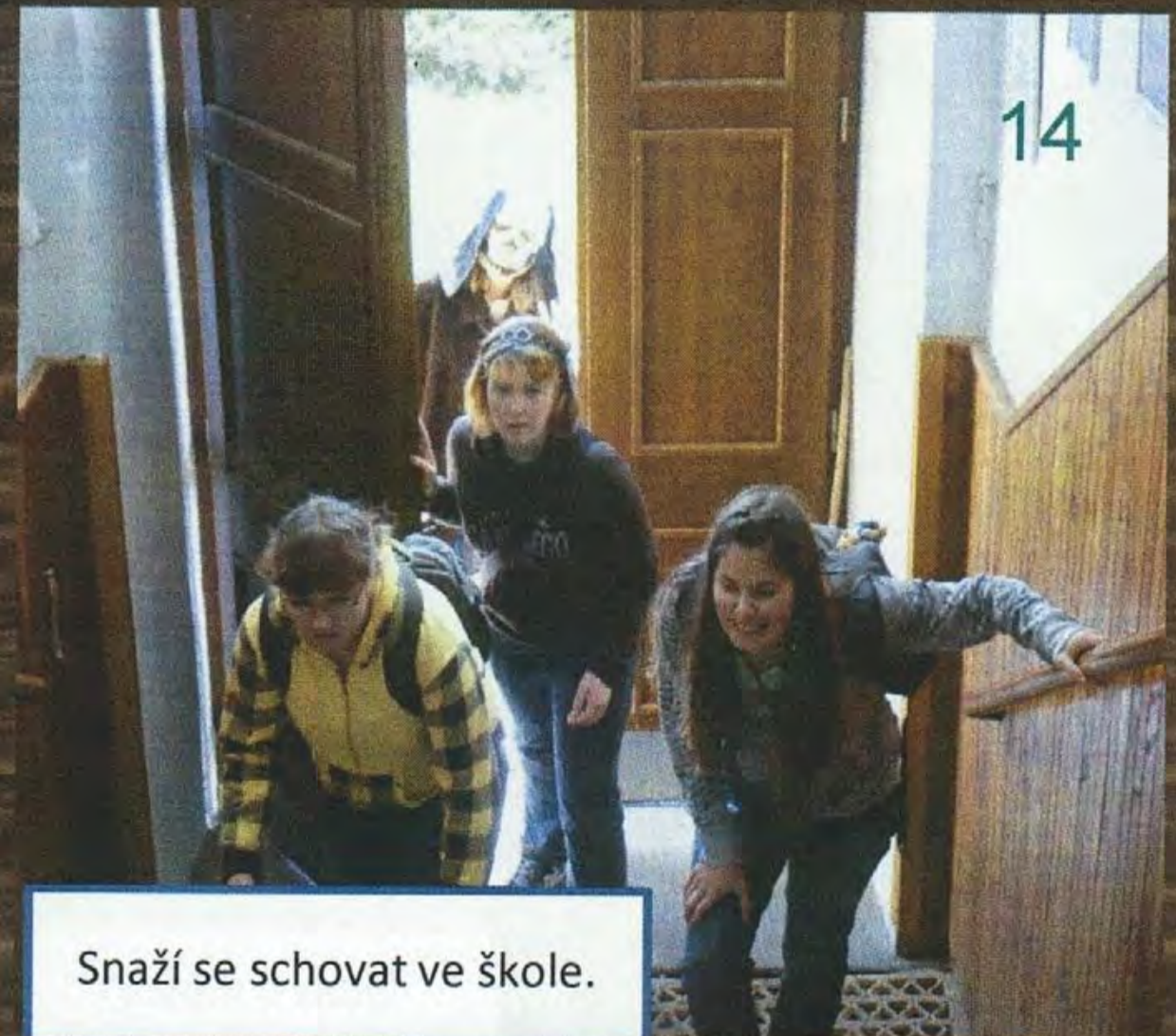
Snaží se schovat ve škole.