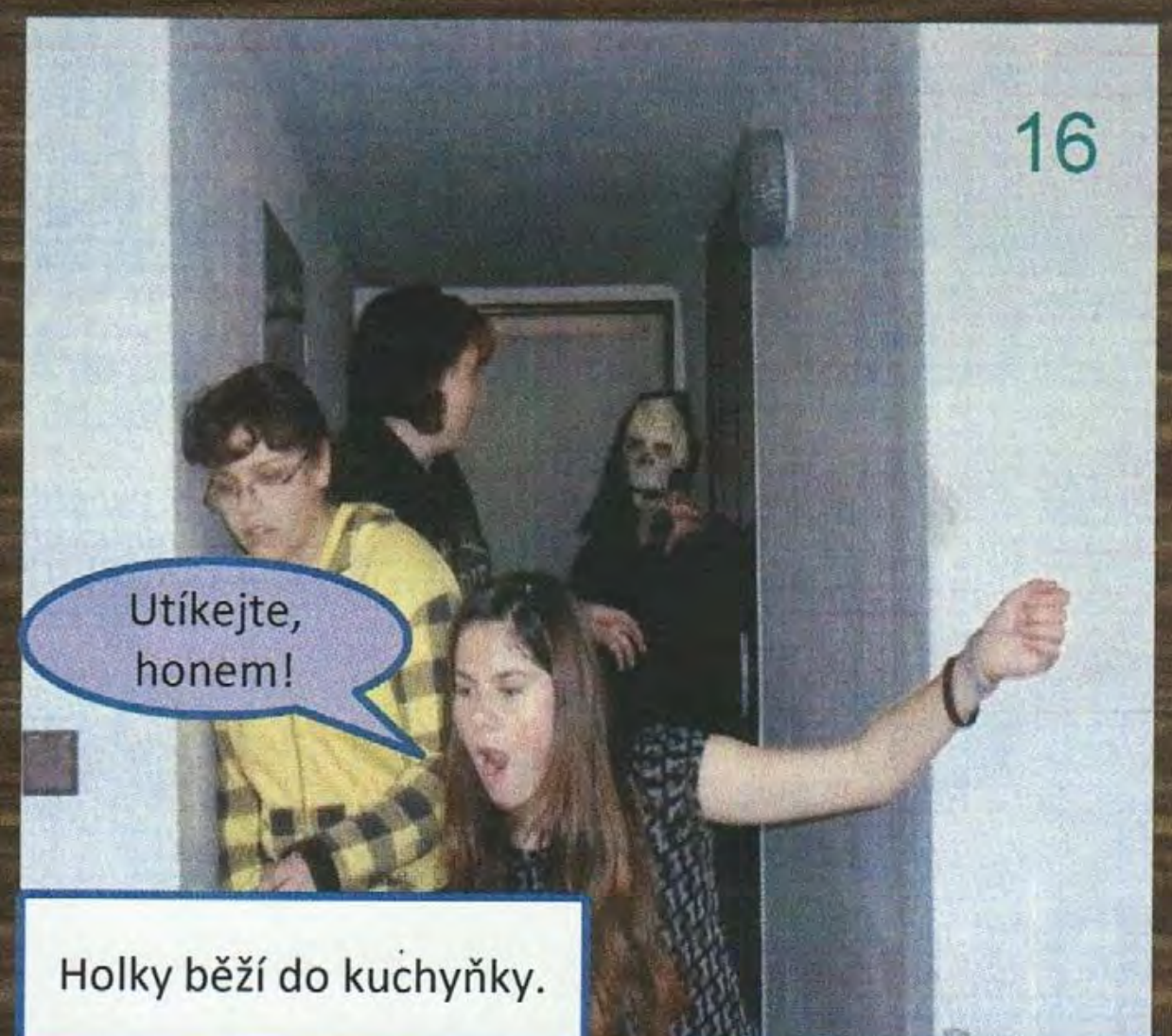
Holky běží do kuchyňky.