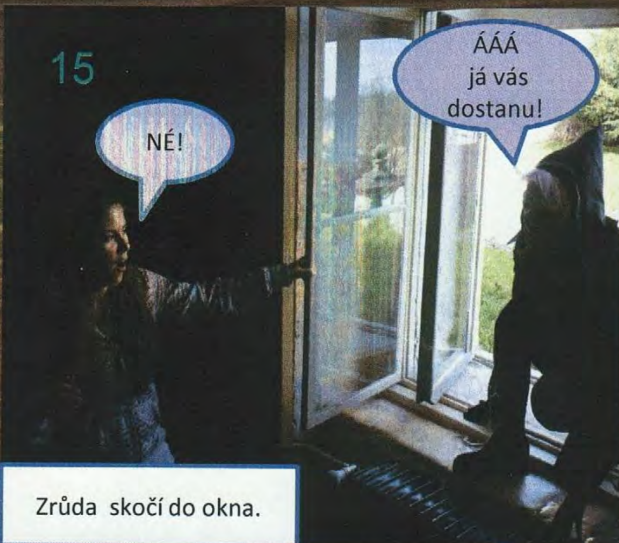
Zrůda skočí do okna.